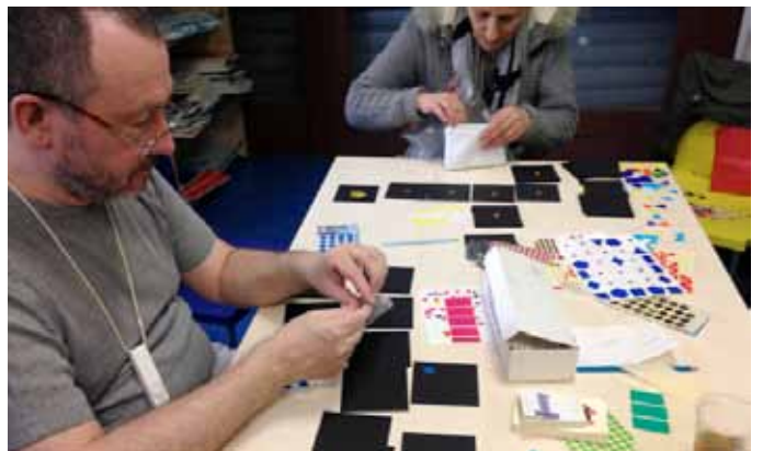
SÉANCES DE TRAVAIL - ATELIERS 2014-2015