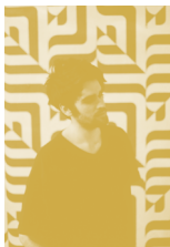
© Acid Arab par Flavien Phoreau